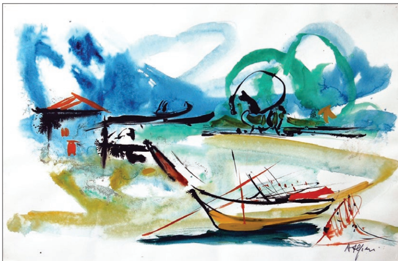
Gabicce, 1974, china e acquerello su cartoncino