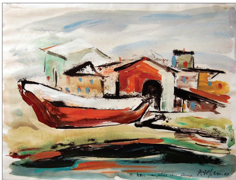
Gabicce, 1974, acquerello e tempera su carta

terreno di sperimentazione immediata, dove gesto grafico e stesura pittorica dialogano senza soluzione di continuità. Da un lato, le carte degli anni Settanta documentano la sua propensione per il tratto rapido e la tensione fra pieno e vuoto; dall'altro, le opere a colori traducono lo stesso impulso evocativo in accordi tonali vibranti. La prossimità cronologica dei due cicli rivela un'identica ricerca di sintesi espressiva: l'artista oscilla fra la sottrazione geometrica e la modulazione cromatica, fedele all'idea di trasfigurare la percezione visiva in un'astrazione lirica.