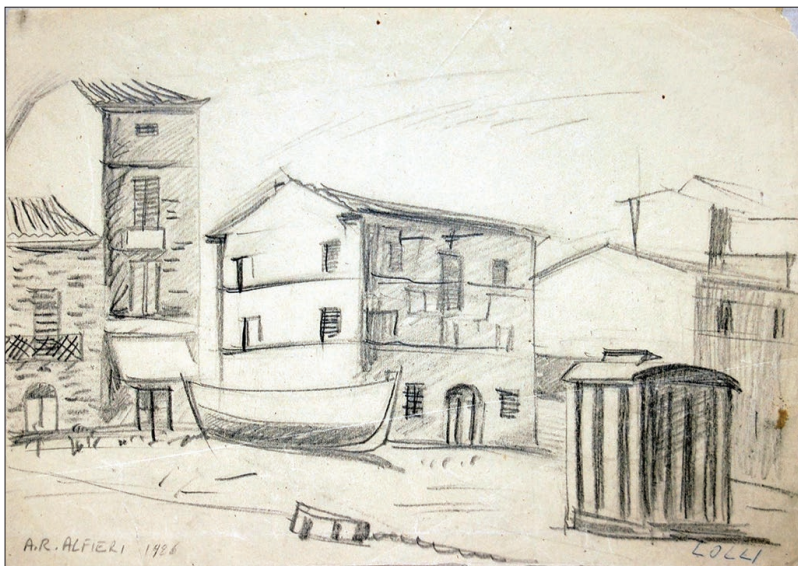
Porto Recanati, 1926, matita su carta