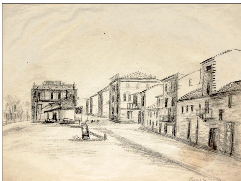
Porto Recanati, 1926, matita su carta

L'esperienza grafica di Attilio Alfieri oscilla fra astrazione lirica e memoria figurativa, spostandosi con disinvoltura dal nero dell'inchiostro alle trasparenze cromatiche. Il risultato è una vera e propria liturgia del gesto, in cui ogni linea e ogni macchia di colore concorrono a delineare un paesaggio emozionale, al tempo stesso familiare e sospeso in una dimensione intemporale . Attraverso queste operazioni di sottrazione e di amplificazione tonale, Alfieri rinnova la tradizione del vedutismo, proponendo un linguaggio grafico e pittorico che continua a parlare, con forza e delicatezza, al pubblico contemporaneo.