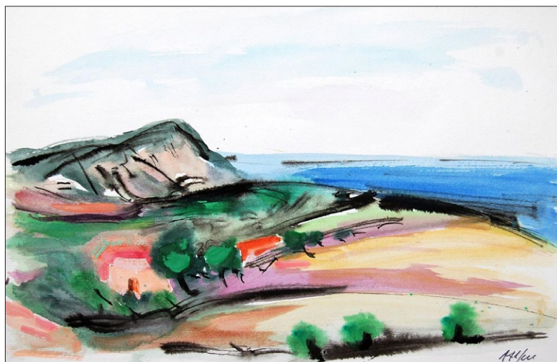
Conero, 1975, acquerelli e tempera su cartoncino