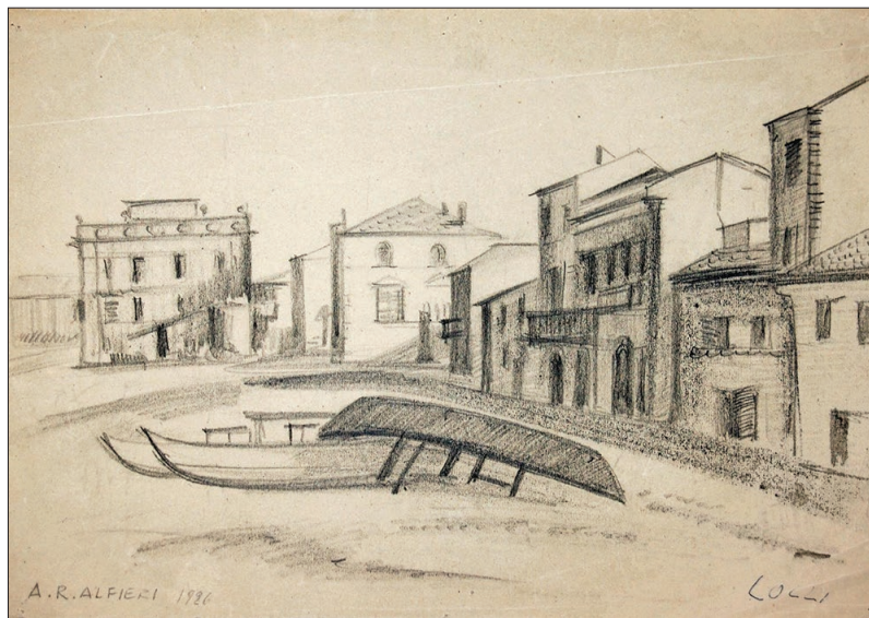
Porto Recanati, 1926, matita su carta

to sul limite della visione. I verdi intensi e gli ocra caldi si distribuiscono in campiture larghe e non finite, dove la vibrazione cromatica resta sospesa tra la definizione della forma e il flusso instabile dell'energia pittorica. Nell'opera Vigneti sul Conero (1975), in Vigne e Conero (1984) e, in particolare, in Gabicce (1969), la presenza del mare si fa più esplicita, ma non per questo meno enigmatica. In quest'ultima opera, una barca rossa campeggia in primo piano, tra case stilizzate immerse in un'atmosfera sospesa, quasi irreale. Il tratto nero, incisivo e strutturante, ordina le forme con decisione, mentre l'acquerello consente al colore di trasudare, evocando l'inquietudine di un'acqua non visibile. Qui il mare non si manifesta come distesa naturale, ma si concentra nella barca stessa, divenuta reliquia silenziosa di un altrove. Non vi è porto, né orizzonte: la barca, immobile sulla terra, allude a un viaggio interrotto o a un naufragio dell'anima. Il motivo marino si interiorizza e si fa metafora di un'attesa, di una sospensione, di una tensione fra il desiderio del moto e la stasi della realtà.