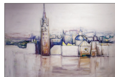
Cattedrale di Siviglia