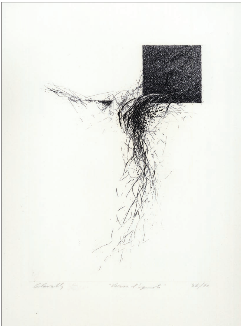
Verso l'ignoto, acquaforte e puntasecca