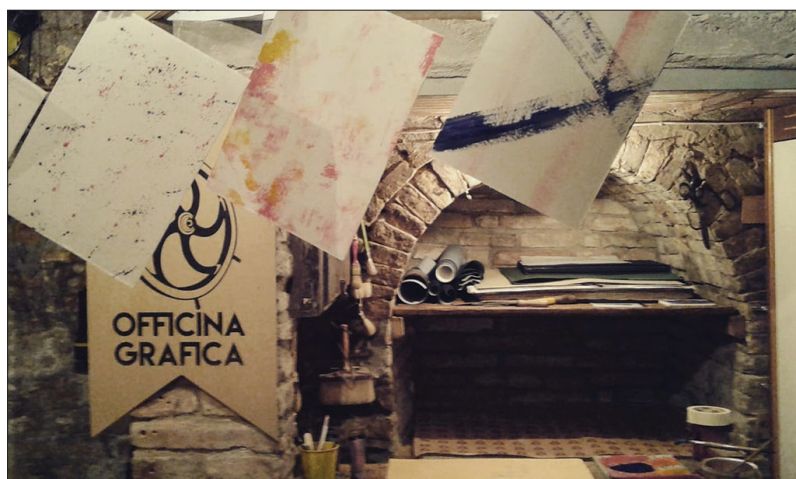
Stamperia Officina Grafica