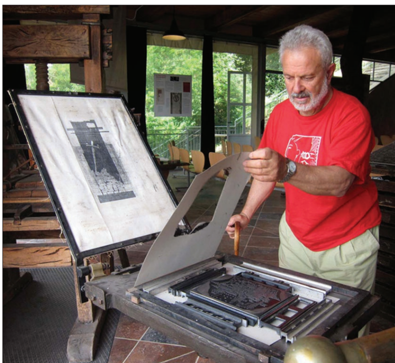
Stamperia Corte della Miniera