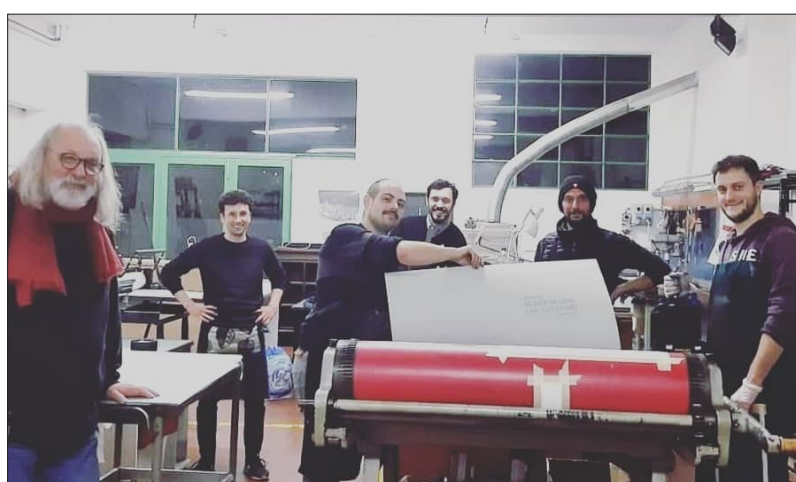
Stamperia Studio Arte Italic