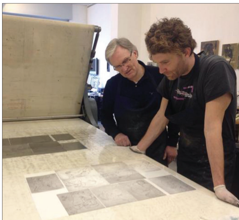
Stamperia Corrado Albicocco

Molti di questi si dedicano esclusivamente alla stampa originale d'arte mentre altri si specializzano nella produzione di preziose edizioni d'arte, dove incisione e testo letterario si coniugano a celebrare la "poesia del segno". Andrebbe dedicato certamente uno spazio maggiore per poter illustrare a dovere quello che è stato a tutti gli effetti un fenomeno irripetibile di fermento artistico e culturale, ma possiamo in questa sede almeno citare alcuni dei protagonisti, con buona pace di quelli che, senza volere, ometteremo.