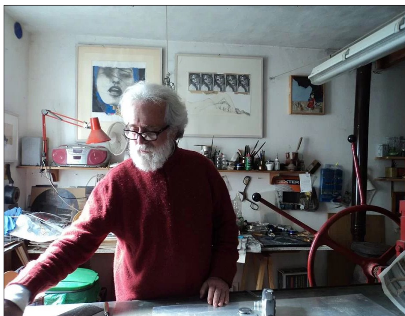
Stamperia Giordano Perelli