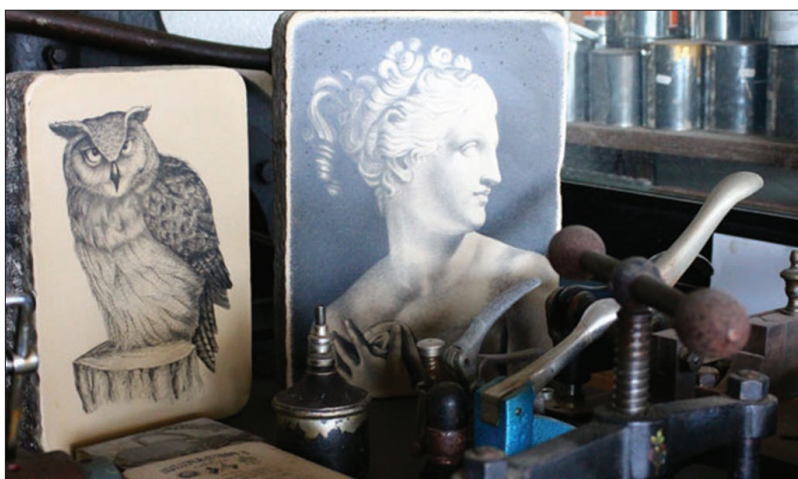
Stamperia Santa Chiara