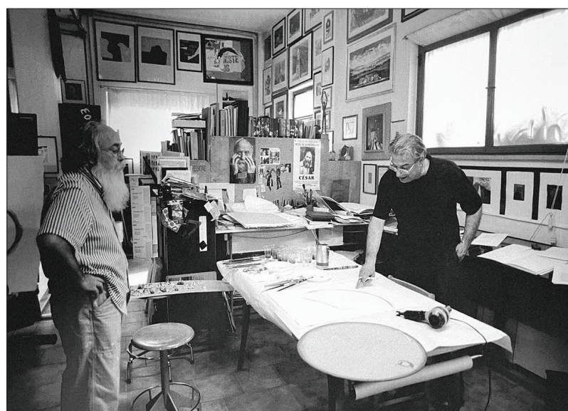
Stamperia d'Arte GF

Un nucleo piccolo, certamente, ma sintomo di una tradizione che non si spegne e che anzi rinasce, si ravviva forte di un'eredità importante e di un patrimonio inestimabile, quella competenza tecnica e creativa degli incisori e stampatori della Scuola di Urbino, un'eccellenza che ha conquistato il mondo.