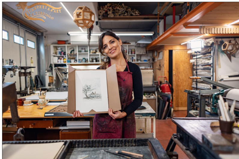
Stamperia Cà Virginio