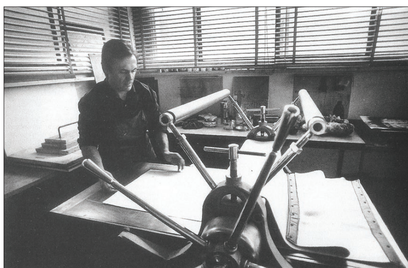
Stamperia della Pergola