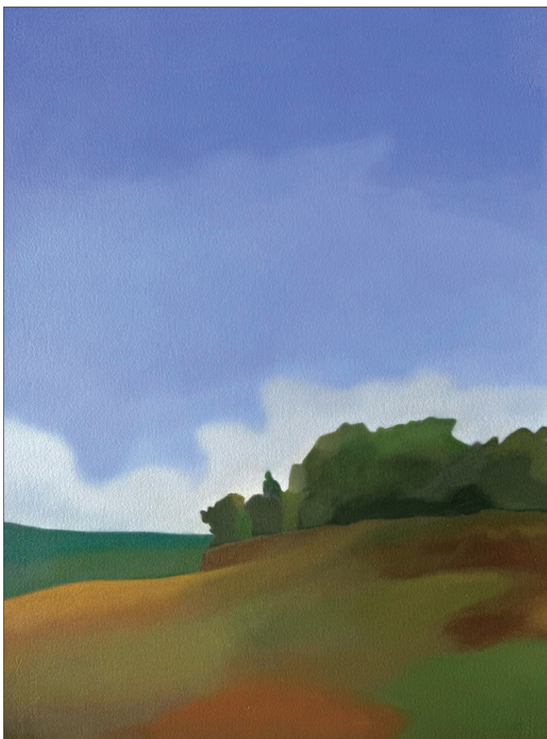
“Echi del Montefeltro”