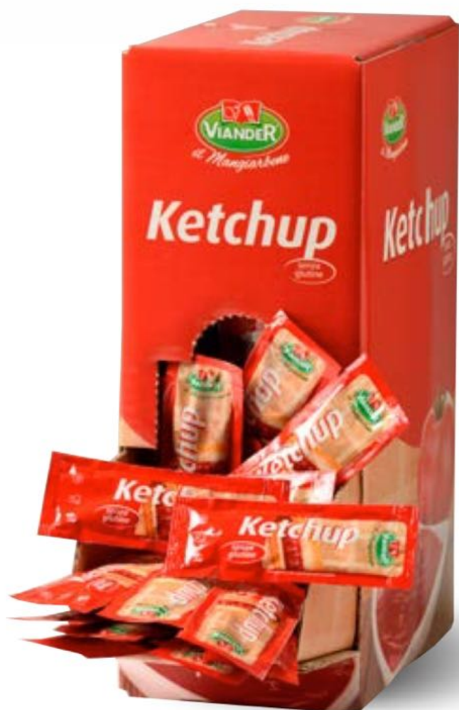
Ketchup Tomato ketchup single-serve sachets cod. 15490 - 250 x 15 g