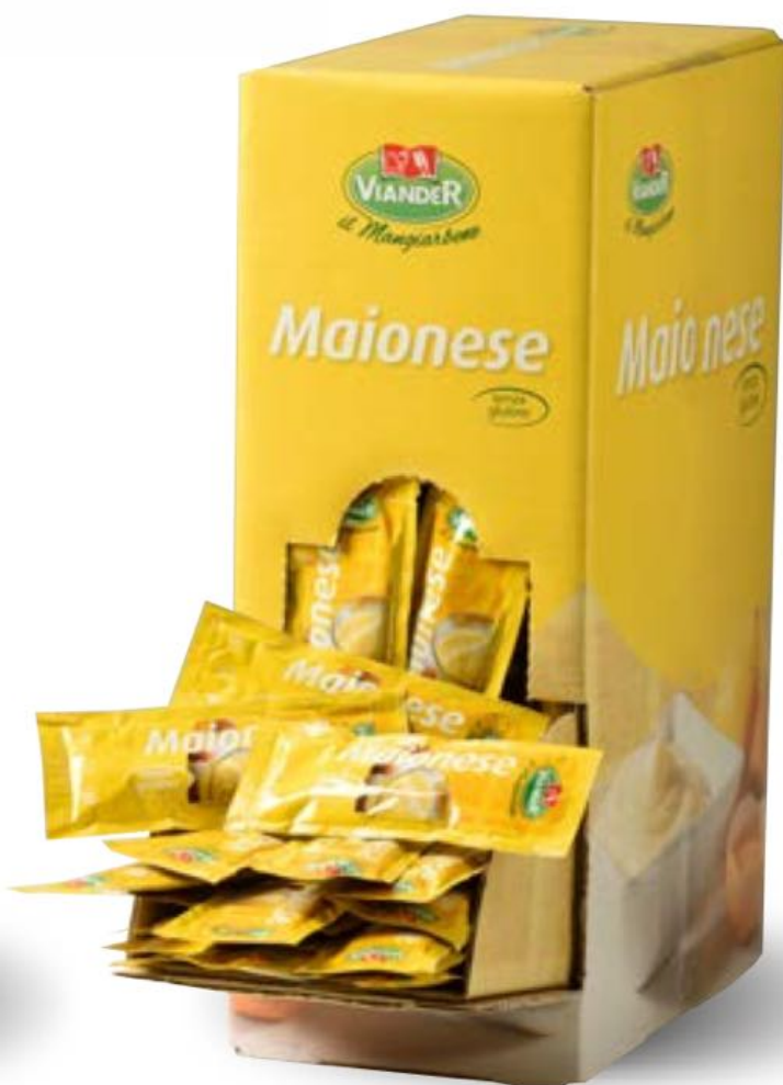
Maionese Mayonnaise single-serve sachets cod. 14020 - 250 x 15 g