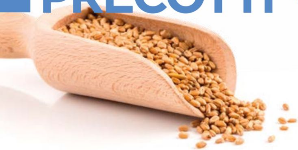
Mix 4 Cereali Mix 4 Cereals cod. 25187 - 1 Kg

Developed specifically for their tastiness and simple pan-preparation, spelt rice & dumpling dishes can be prepared in two minutes with just a little creativity in terms of toppings... leave the rest to us.