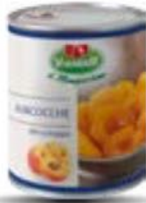
Albicocche allo sciroppo Peeled apricots in syrup cod. 13012 - 1/1

Fancy and highly-varied fruit salads, or else apples, plums, apricots, pears, pineapples and peaches available throughout the year: for us, this is what food service is all about... that which the Customer wants, combined with that which they aren't expecting.