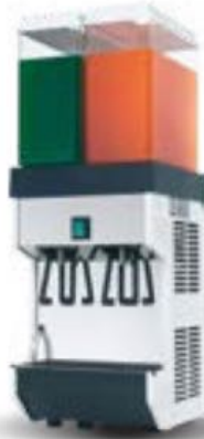
Frigo bibita cod. 99142