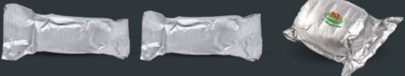
Tacchino Arrosto Roasted turkey cod. 32242 - 2-2,5 Kg