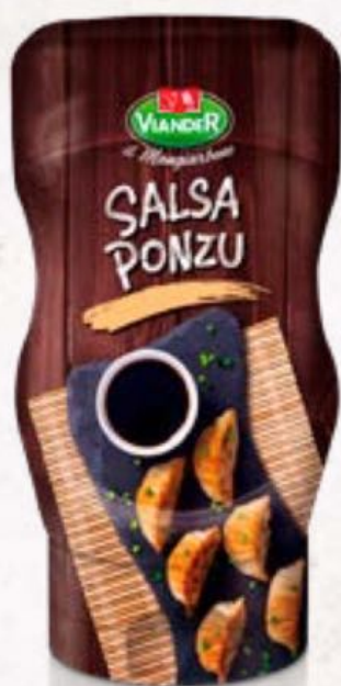
Salsa Ponzu cod. 15370 - 290 ml