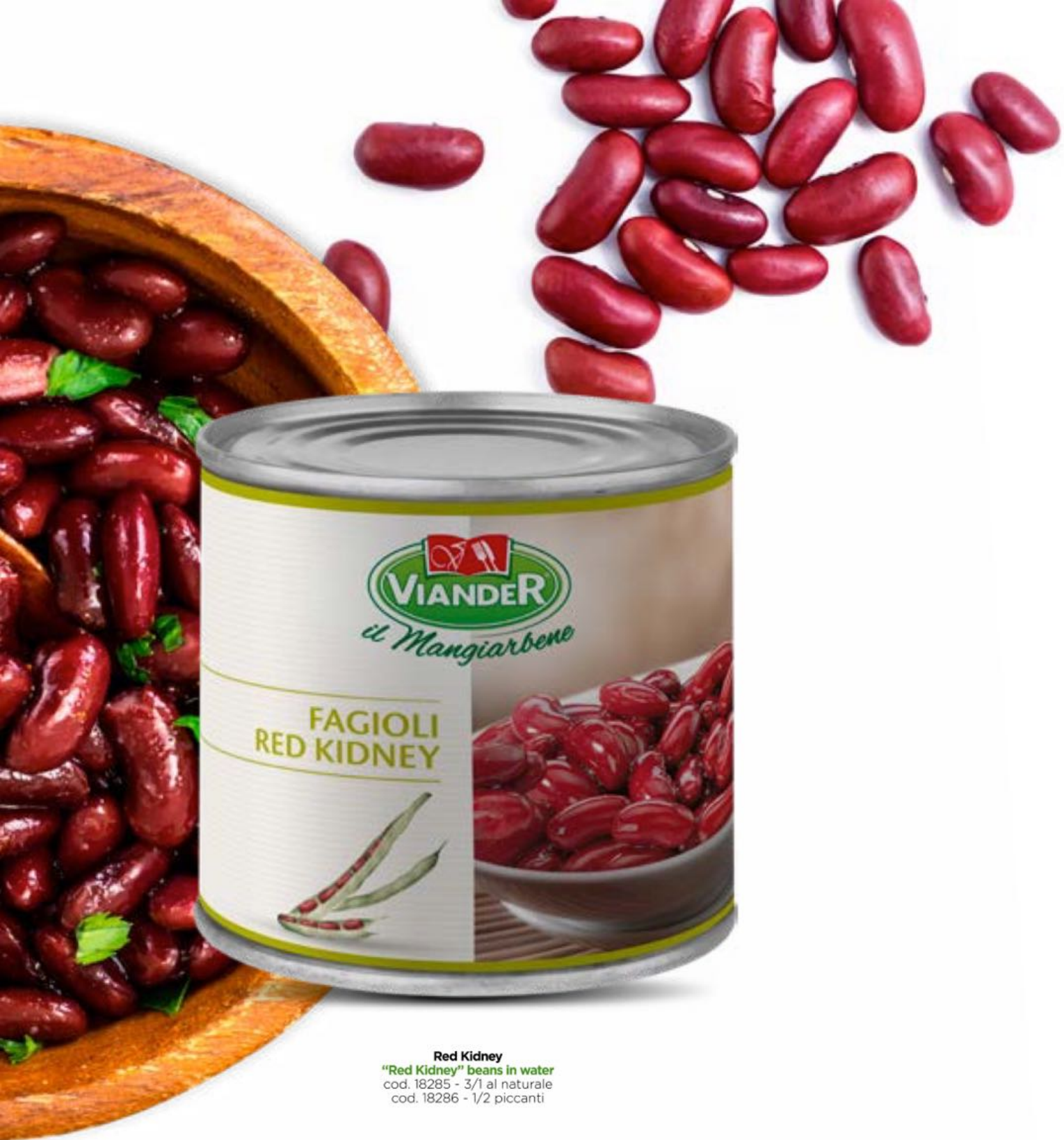
Red Kidney "Red Kidney" beans in water cod. 18285 - 3/1 al naturale cod. 18286 - 1/2 piccanti