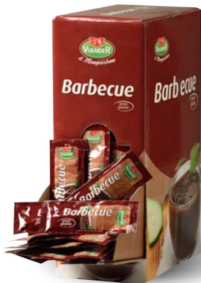
Salsa Barbecue Barbecue Sauce single serve sachets cod. 15256- 250 x 15 g