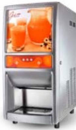
Distributore succhi cod. 99288

Modalità erogazione: bicchiere/Caraffa Ideale per strutture da 40-50 stanze