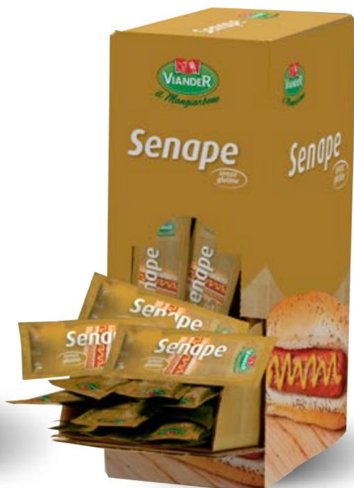
Senape Mustard single-serve sachets cod. 15405 - 250 x 15 g