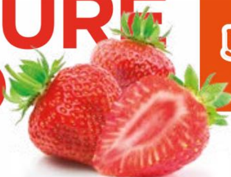
Fragole Strawberries cod. 35045 - 28g