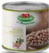
Borlotti "Borlotti" beans in water cod. 18255 - 3/1 cod. 18250 - 1/2