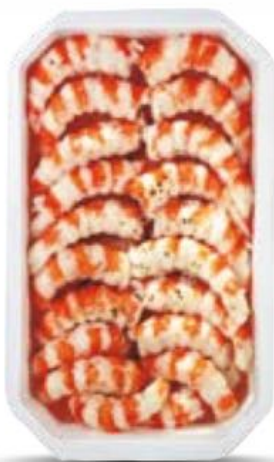
Surimi di Gamberi Prawns surimi cod. 27091 - 2 Kg