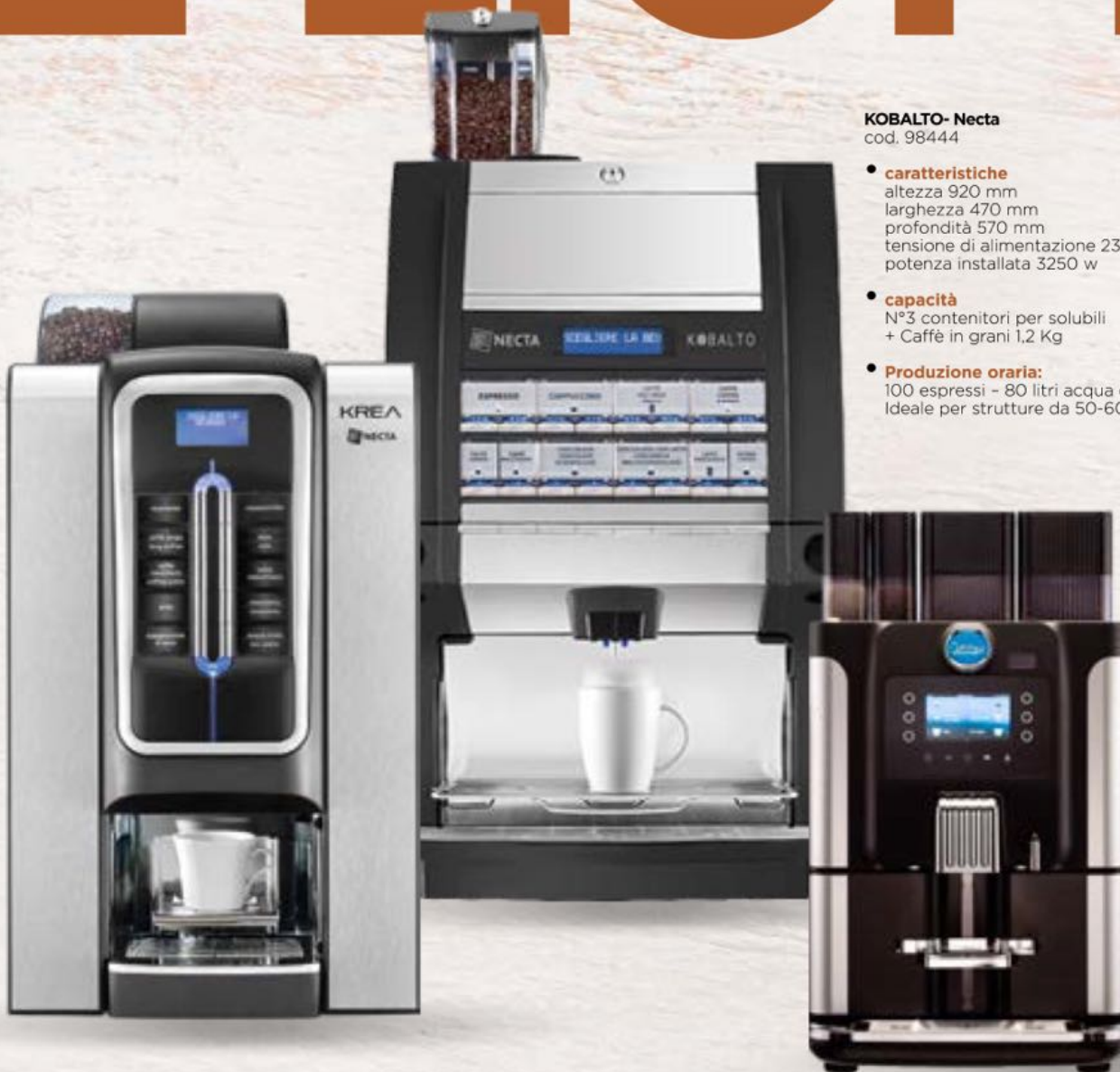
KREA - Necta cod. 98085