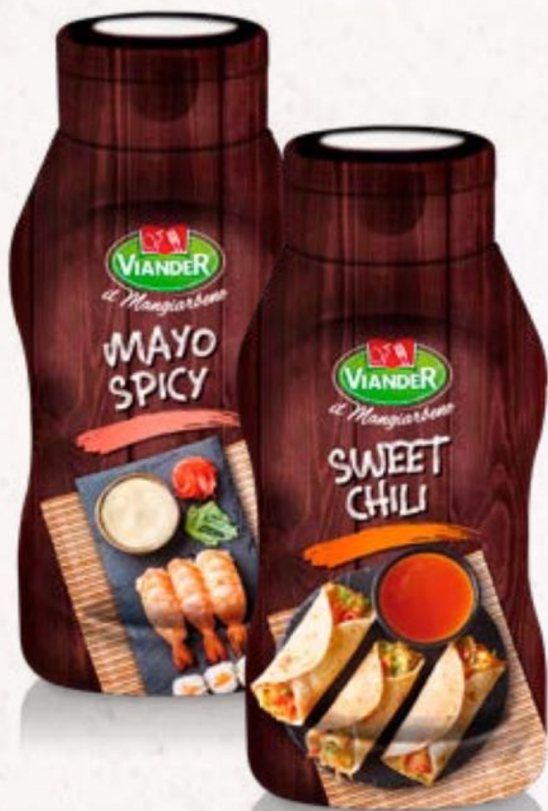
Mayo Spicy cod. 15376 - 500 ml