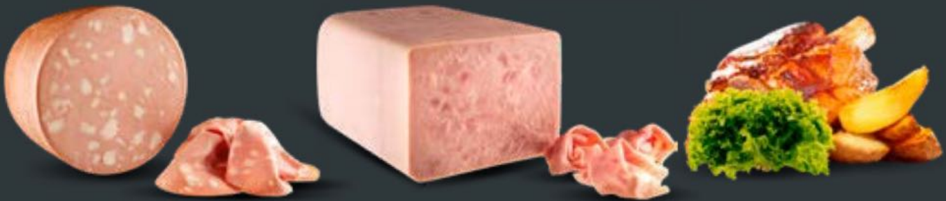
Cotechino Precotto Cotechino (pork sausage) cod. 32247 - 500 g cod. 32266 - 500 g Astuccio