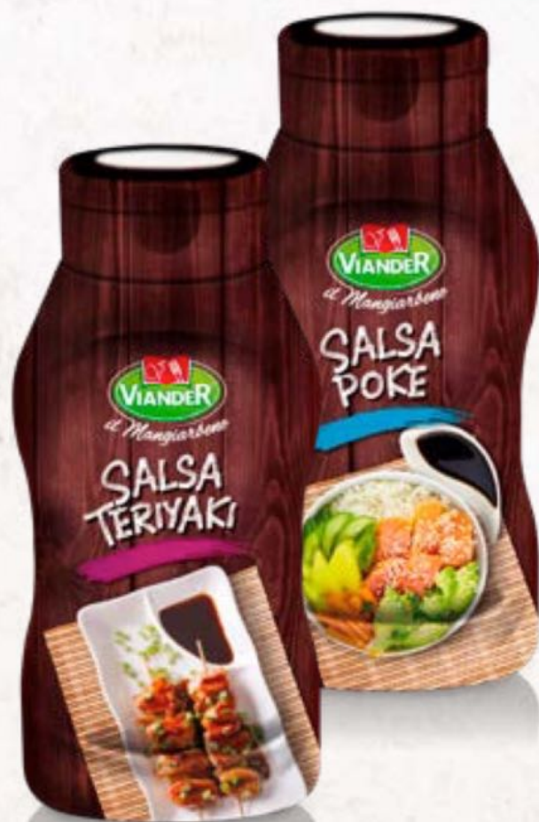
Salsa Teriyaki cod. 15373 - 500 ml