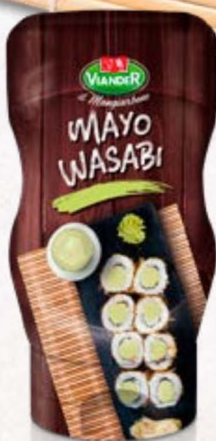
Mayo Wasabi cod. 15371 - 290 ml