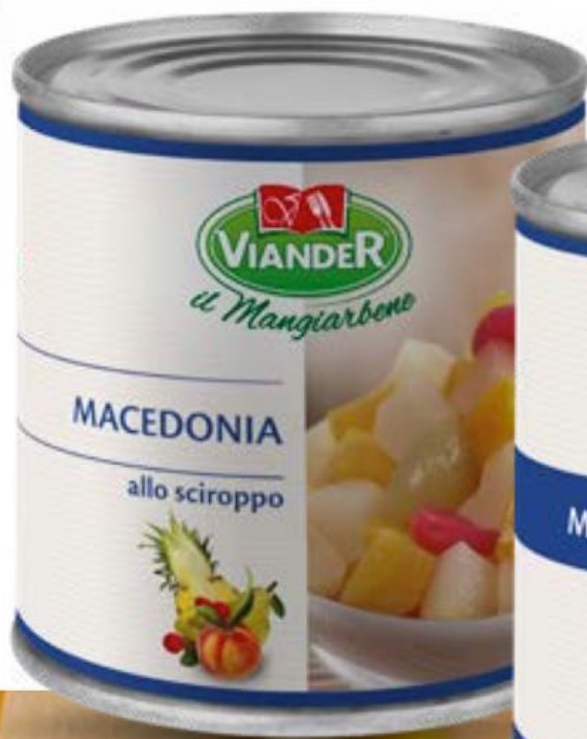
Macedonia Rustica Pezzettoni Fruit salad in syrup (big pieces of fruit) cod. 13062 - 3/1