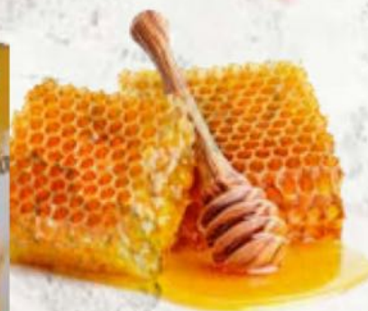
Miele Single-serve sachets honey box cod. 35025 - 1,2 Kg