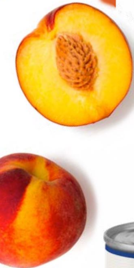
Macedonia allo sciroppo Fruit salad in syrup cod. 13061 - 3/1 cod. 13060 - 1/1