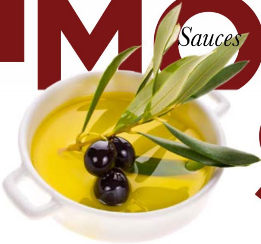
Olio Extravergine di Oliva Italiano ITALIAN Extravirgin olive oil cod. 09042 - 100 x 10 ml