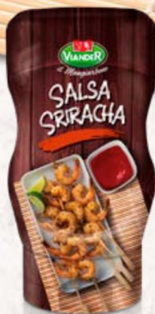
Salsa Sriracha cod. 15372 - 290 ml