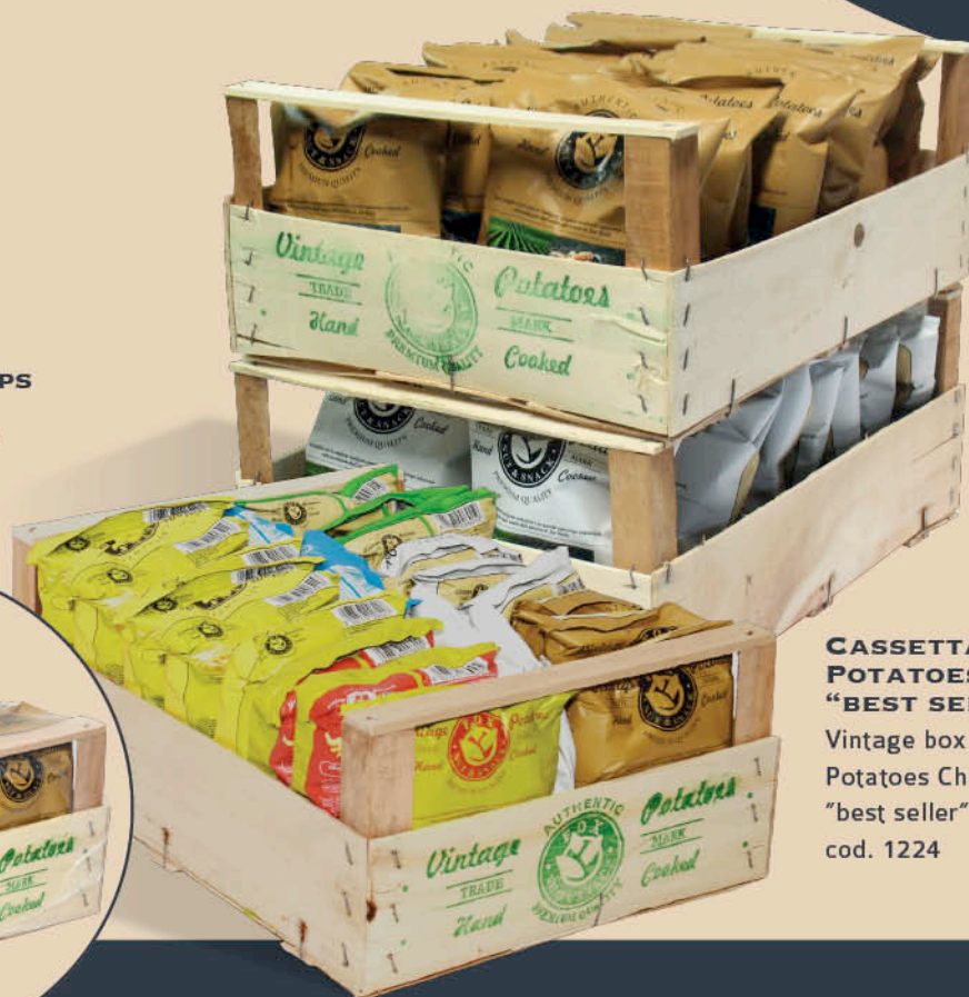
CASSETTA VINTAGE POTATOES CHIPS "BEST SELLER"

Vintage box Potatoes Chips "best seller" cod. 1224