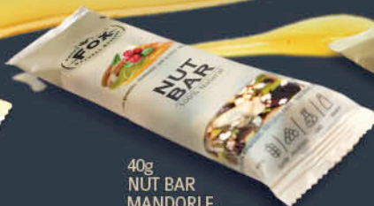
40g NUT BAR MANDORLE, MIRTILLI ROSSI & SEMI DI ZUCCA