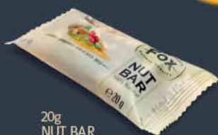
20g NUT BAR MANDORLE, MIRTILLI ROSSI & SEMI DI ZUCCA