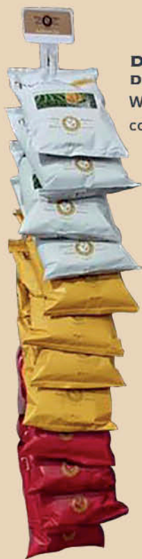
DISPENSER DA PARETE Wall display cod. 80032

Expositor from the ground Vintage Potatoes and tortilla chips cod. 80033