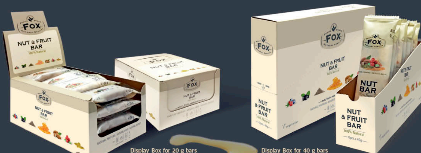
Display Box for 20 g bars Capacity: 20 pcs. x 20 g bars