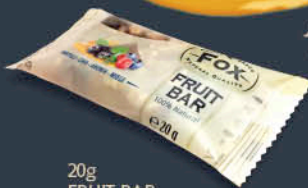
20g FRUIT BAR MIRTILLI, CHIA, ARONIA, MIELE