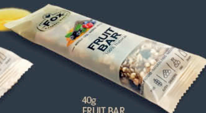
40g FRUIT BAR MIRTILLI, CHIA, ARONIA, MIELE