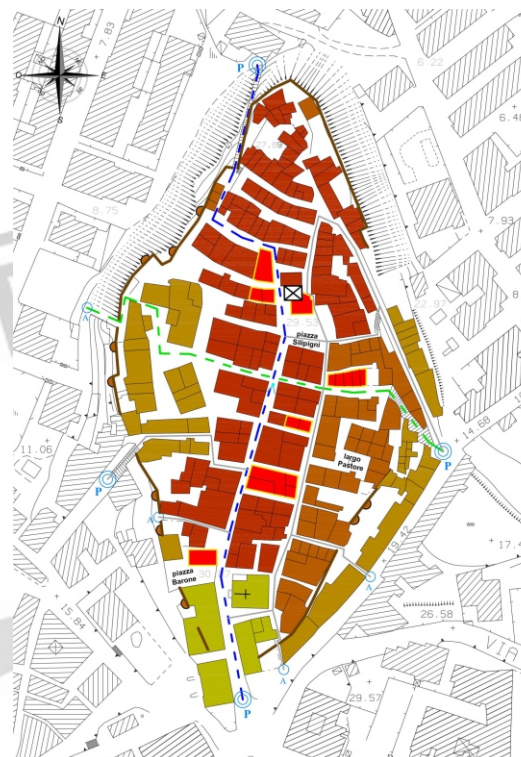
Tavola evoluzione urbana

Per quanto riguarda la seconda fase, con la valorizzazione del pendio della vecchia cinta muraria con verde terrazzato a gradoni e percorso pedonale, mettere in sicurezza per riaprire al pubblico questo patrimonio storico sotterraneo.