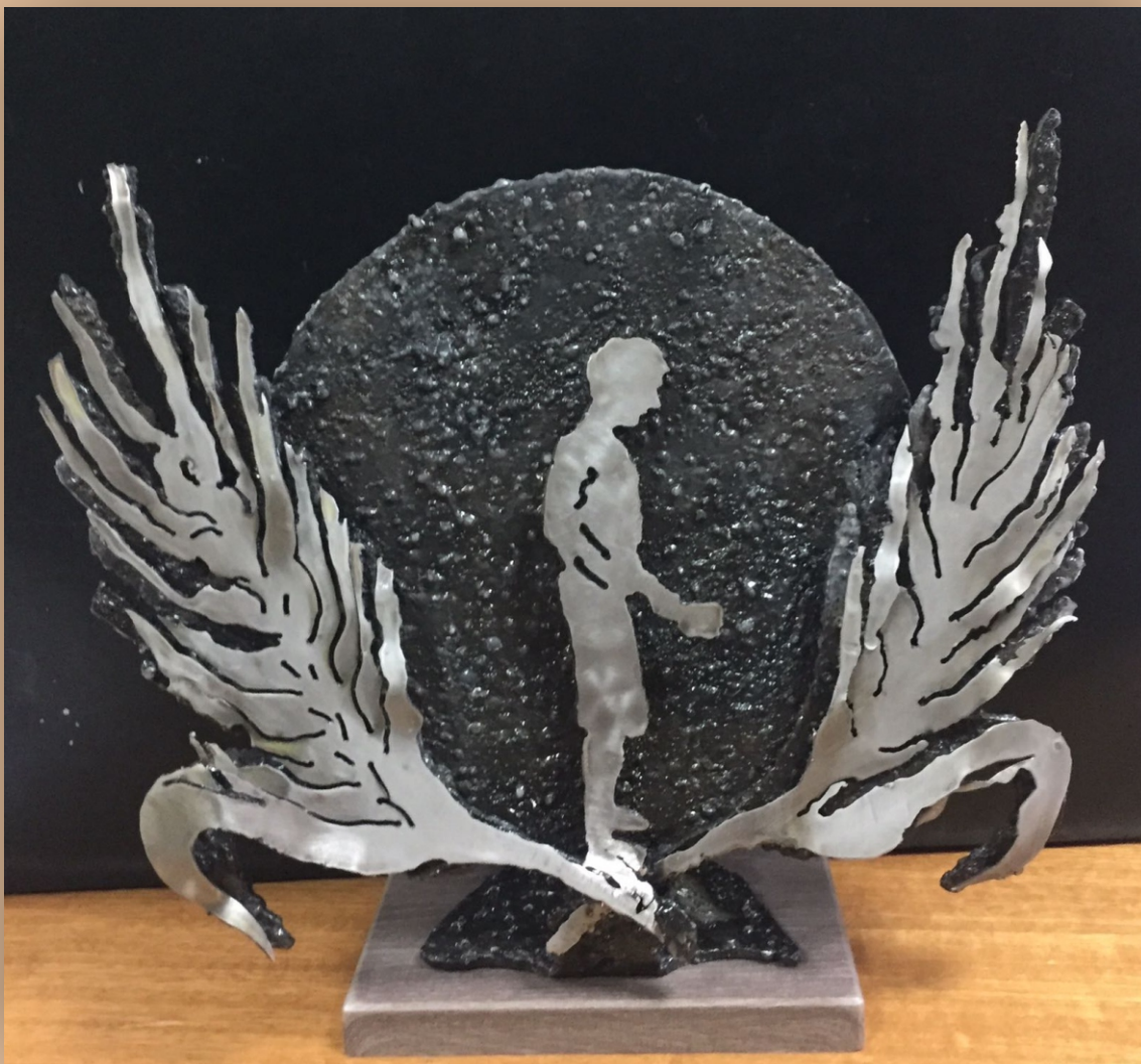
Il premio Pina Alessio realizzato dallo scultore Cosimo Allera