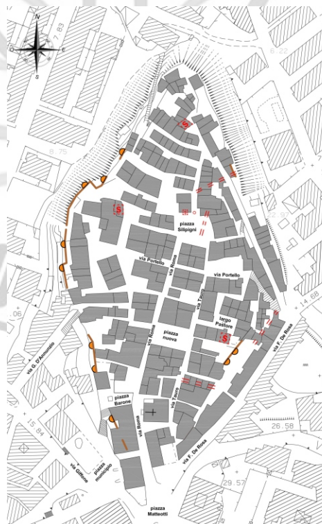
Tavola cunicoli sotterranei