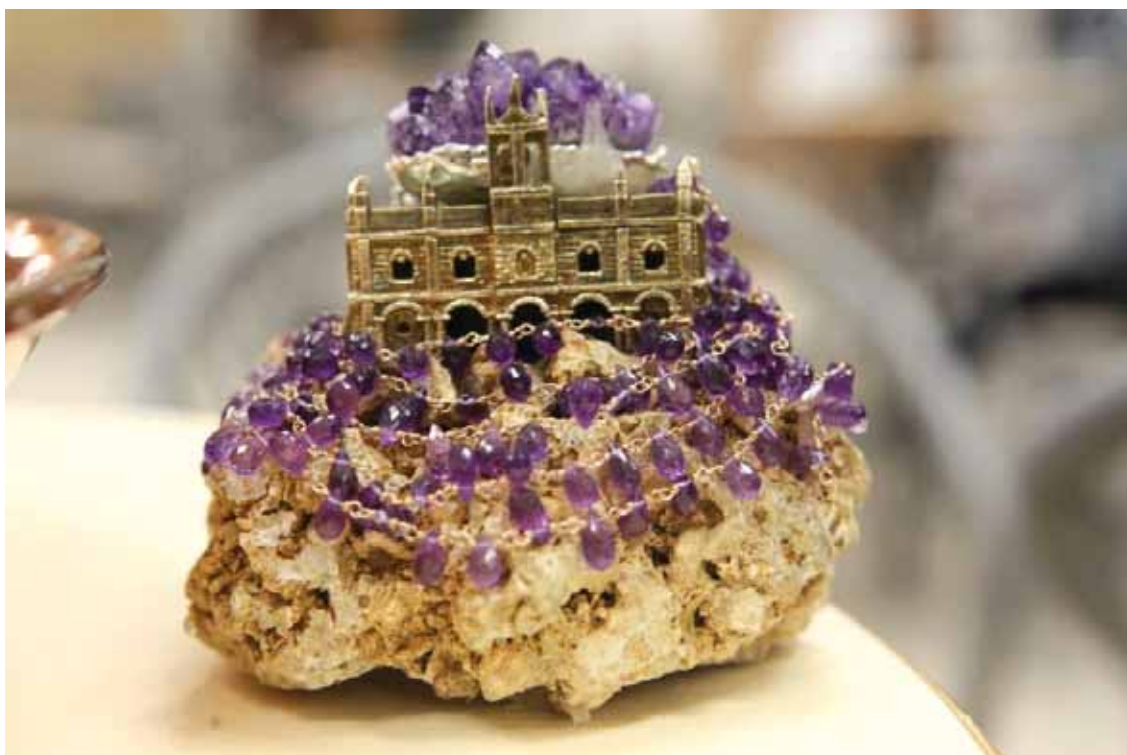
Gioiello tempestato di pietre preziose che omaggiano la cipolla di Tropea