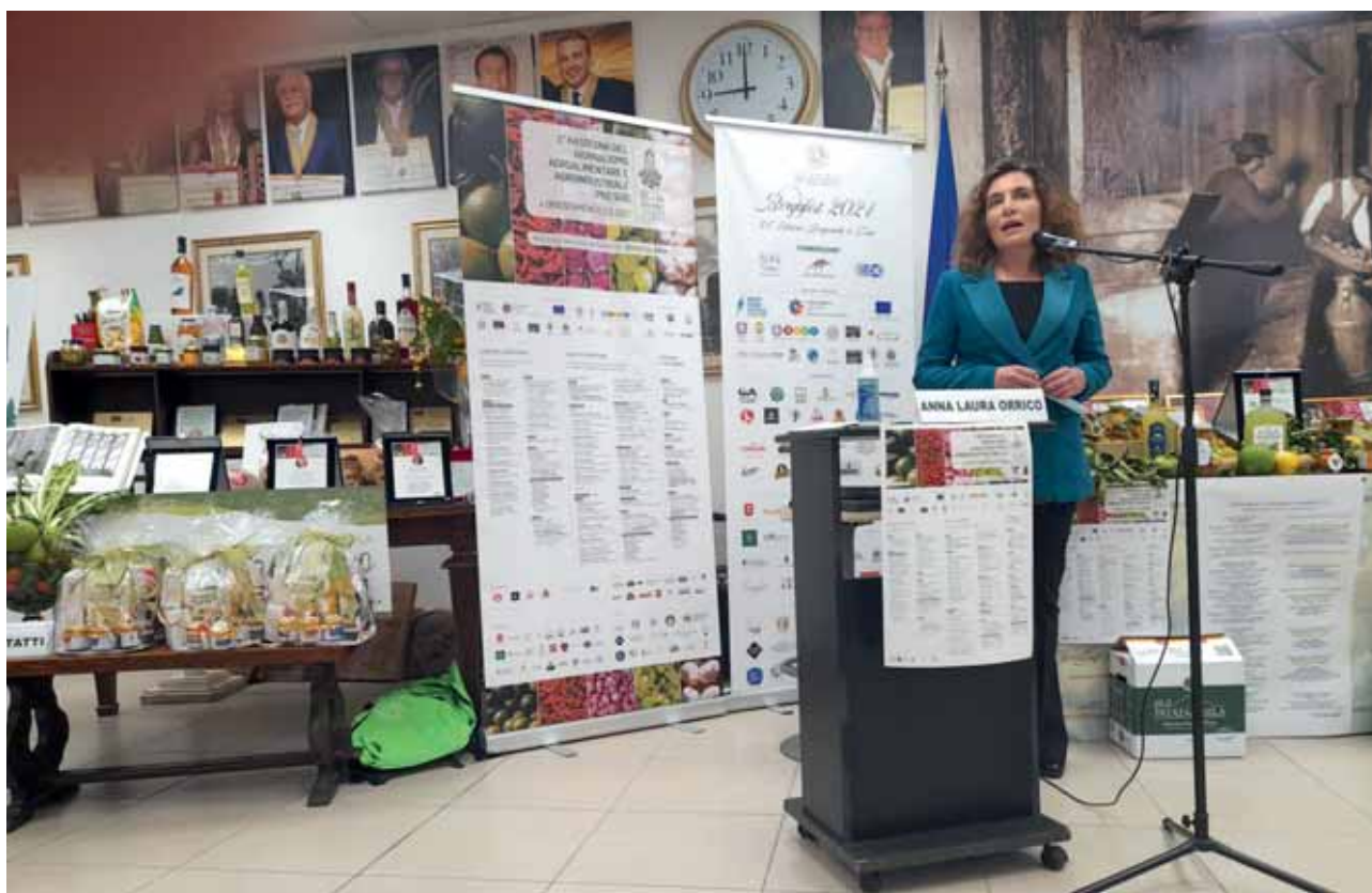
L'on. Anna Laura Orrico, già Sottosegretario per i beni e le attività culturali.