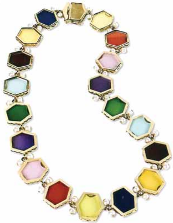
Collana "Mattonelle" che trae ispirazione dal mosaico della pavimentazione di un edificio termale situato nell'area archeologica di Capo Colonna risalente al I sec. A. C.

Molto toccante pure l'incontro con Papa Wojtyła, quando donai una bifora raffigurante la Madonna di Capocolonna e la Madonna di Czestochowa.