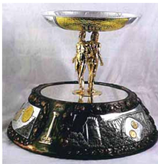
L'opera "Ti racconto la Calabria" realizzata per Expo Milano 2015.