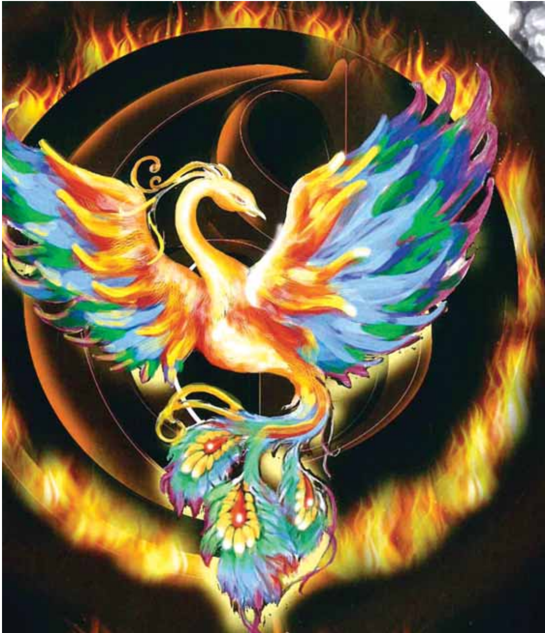
Uno dei disegni relativi all'Araba Fenice, l'uccello mitologico che risorge dalle proprie ceneri

Ed infine, e non per importanza, la collaborazione con la Fondazione Modigliani per una serie di gioielli per i festeggiamenti dei 1600 anni della Serenissima.