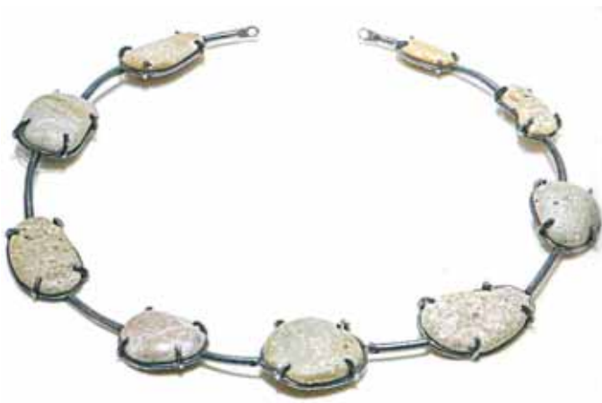
La collana di cuticchie realizzata dal Maestro a 12 anni.