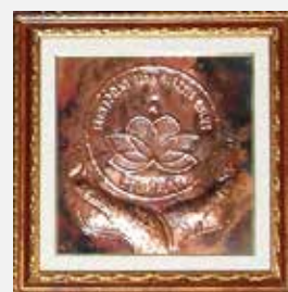
Il Premio Pina Alessio realizzato dall'orafo Giuseppe Sindone

Non ti arrendere mai, alza il capo e combatti, la vita può essere dura, ma tu lo sei di più. Splendi sempre, anche in mezzo alle lacrime, anche in mezzo al dolore... Non permettere a nessuno di spegnere il tuo sorriso. Sii simile al sole che, nonostante il giorno di pioggia, non si arrende e continua a brillare più forte e più bello di prima.