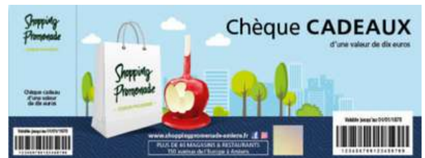
Shopping Promenade – Amiens