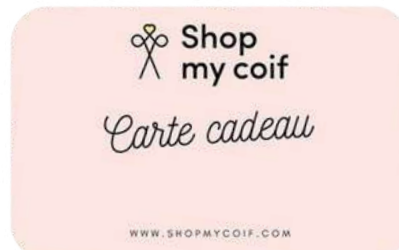
Produits professionnels de coiffure et accessoires.