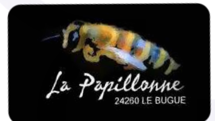
Production artisanale de miel