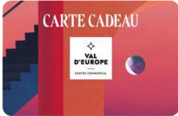
Val d'Europe – Marne la Vallée