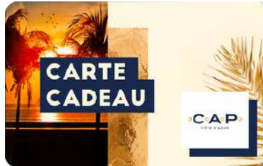
Cap 3000 – Nice