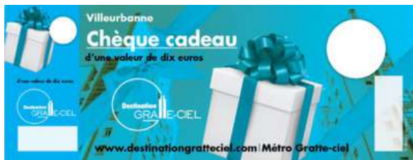
Gratte-ciel – Lyon