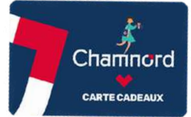
Chamnord – Chambéry