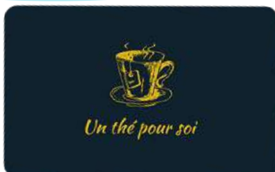
Thés naturels, fleuries et fruités