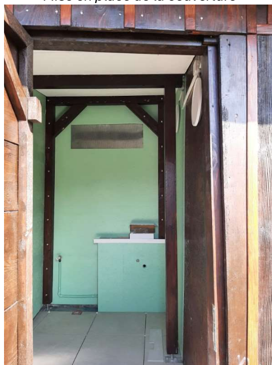
Il ne manque plus que la cuvette de WC et le lavabo