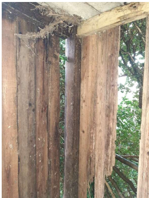
Démontage du cagibi

La pause hivernale a été l'occasion de réaliser le projet de construction d'un local WC. Si la canalisation d'évacuation des eaux usées ainsi que l'alimentation en eau avaient déjà été partiellement réalisées lors des premiers travaux de réfection, tout restait à faire au niveau du local proprement dit. Il a fallu dans un premier temps démolir le local de rangement existant, prolonger l'écoulement des eaux usées et l'alimentation en eau, couler une dalle, monter de nouvelles parois et finalement recouvrir le tout. S'en sont suivis des travaux de peinture, l'installation d'un éclairage, le carrelage et enfin la pose d'une cuvette de WC et d'un lavabo.