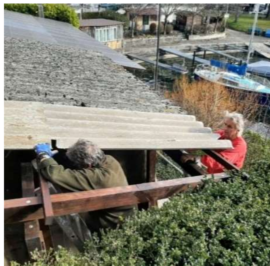
Mise en place de la couverture